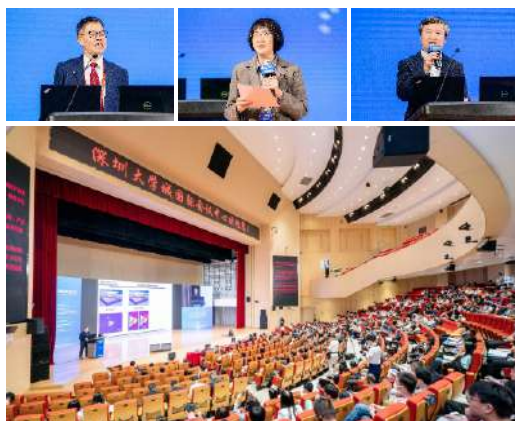
冯新亮 教授 德国德累斯顿工业大学