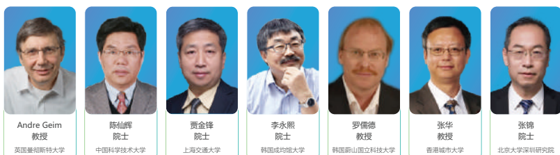
Andre Geim 教授 英国曼彻斯特大学