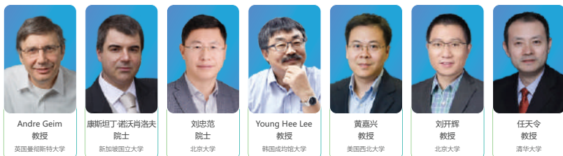
Andre Geim 教授 英国曼彻斯特大学