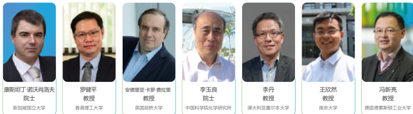
康斯坦丁·诺沃肖洛夫 院士 新加坡国立大学