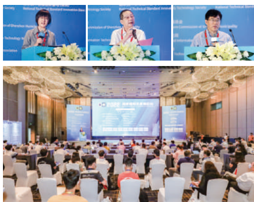
张锦 院士 北京大学深圳研究院