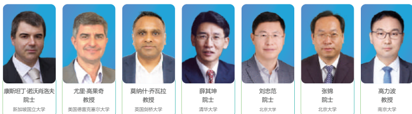
康斯坦丁·诺沃肖洛夫 院士 新加坡国立大学